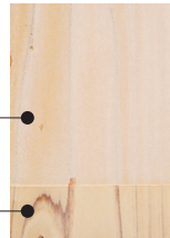
塗装面が白化する