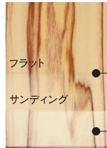
塗装面は白化しない