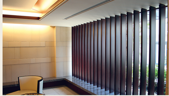
■マンションエントランスホール