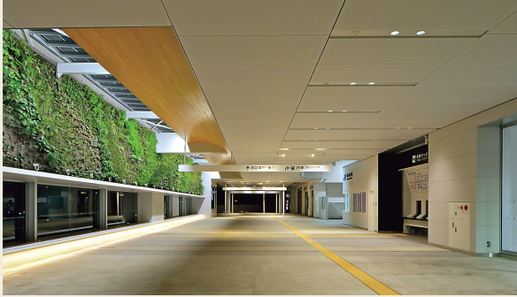
■JR新山口駅南北自由通路